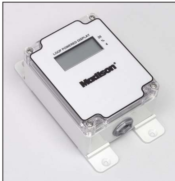
Modèle ED-003 - Compteur à montage mural actionné par un circuit bouclé

Pour utiliser avec la plupart des modèles de capteur à ultrason et radar