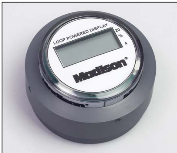
Modèle ED-001 – Compteur à montage sur sonde actionné par un circuit bouclé – Boîtier en plastique

Modèle ED-002 (non illustré) – Boîtier métallique