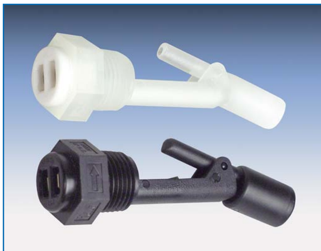
Matériau en polypropylène du M8725 (en haut) Matériau en PBTP du M7725 (bas)

Madison Company offre un contacteur de niveau liquide standard à montage latéral muni d'une cosse rectangulaire mâle d'1/4 po. pour simplifier l'installation électrique. Le montage se fait par filetage de 1/2 po. NPT pour un orifice dans la paroi d'un conteneur. Ces deux fonctionnalités de conception permettent un entretien facile sur place.