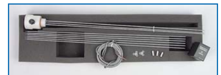
Kit de contacteur de conductivité M3784-110MK